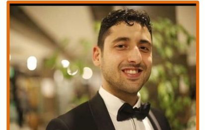
AV. SELAHATTİN YAKIN

KATEGORİ: SİYASET, HUKUK VE KAMU YÖNETİMİ