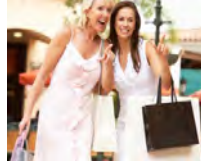
Tüketim konusunda yaşlar arası bir etkileşimin söz konusu olduğu söylenebilir.

Günümüz toplumlarında ise dikkat çekici olan tüke-